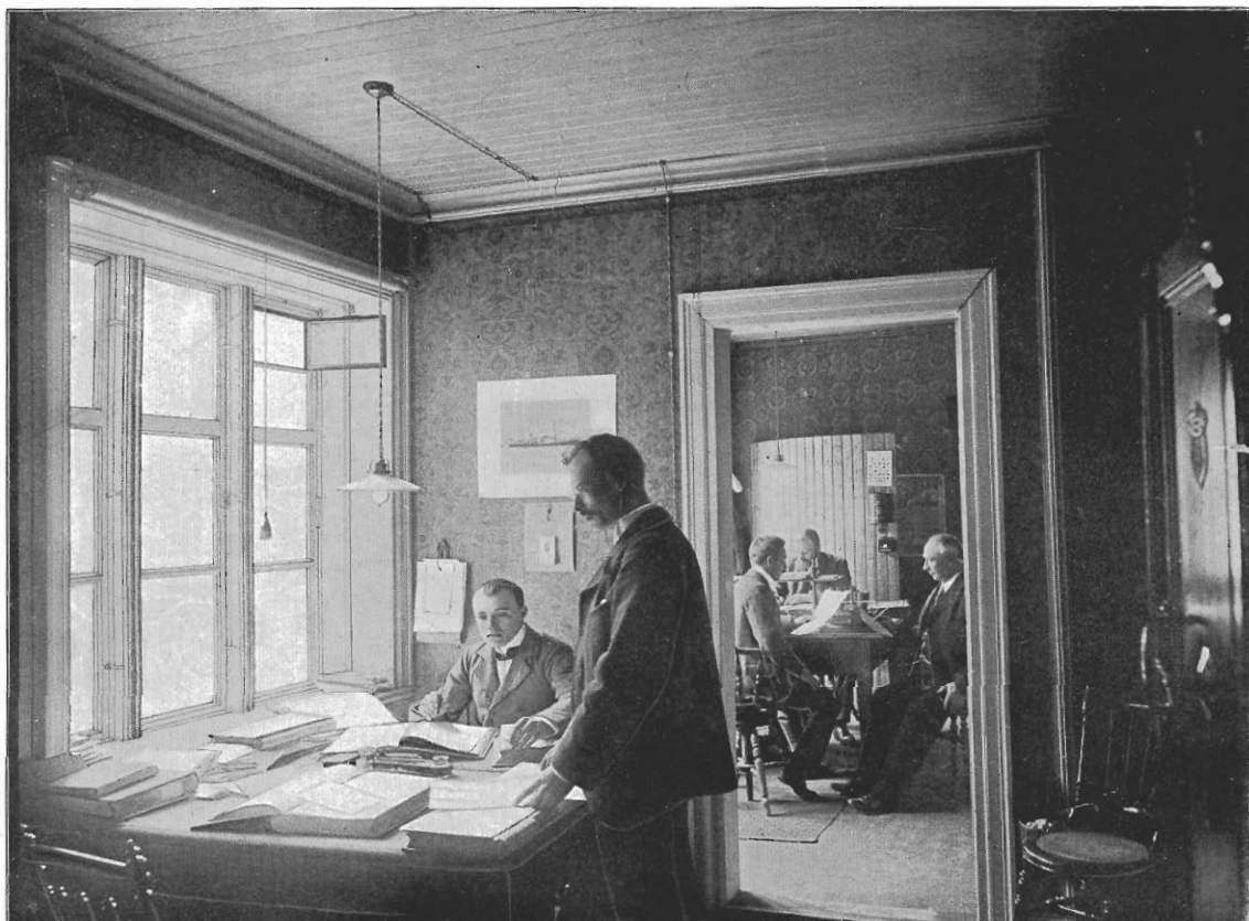
BOGHOLDERIET OG BEFRAGTNINGEN.